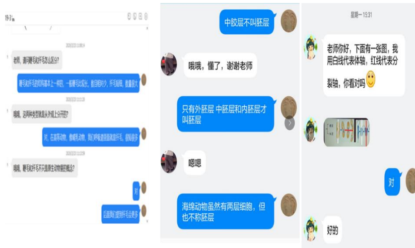
图 5 答疑

在疫情当下，需要利用多种途径和方式开展活动，并及时与学生沟通，及时答疑，才能尽量保证教学效果。