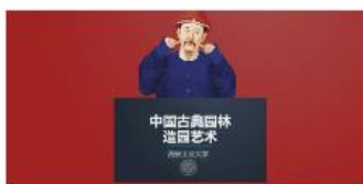
园中国画境 中国古典园林造园艺术 西安工业大学