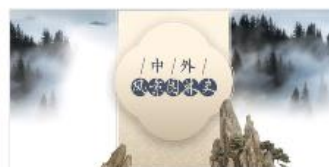
中外风景园林史 同济大学

开学前两周，在教务处的组织下，通过网络积极学习雨课堂、超星等教学平台的使用方法。但是在线教学开始后，发现各大教学平台的用户量剧增，导致各教学平台无法正常使用，影响了教学进程。通过与同事们进行经验交流，最终选择了 QQ 群屏幕共享功能+对分易签到、提交作业的方式进行在线教学工作。