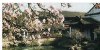
中外古典园林史 南京林业大学

本学期，我承担 2018 级园林班《中外园林史》课程的讲授工作。《中外园林史》是园林专业的基础课，国内不少高校也开设了这门课。开学前，对课程资源进行筛选，以便同学们参考学习。经过精心对比，最终选择中国大学 MOOC 网站上的同济大学《中外风景园林史》、南京林业大学《中外古典园林史》作为参考课程资源。